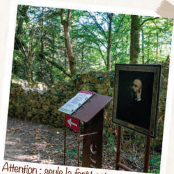
Attention ; seule la forêt est accessible au public. Le château de Ligoure et son parc paysager sont un domaine privé.