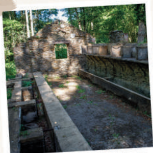
La Pisciculture de Frédéric Le Play