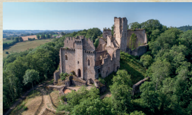
De burcht van Châlucaet (hoog en laag) wordt opgericht door de familie Jaunhac.